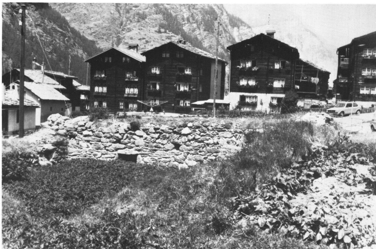
Abb. 5, Täsch. Im Vordergrund das alte Gemäuer in der Bachaufschüttung mit Balkenlöchern auf der Aussenseite.

d. h. der Blockbau war nur an die unregelmässig abbrechende Mauer angeschoben worden.