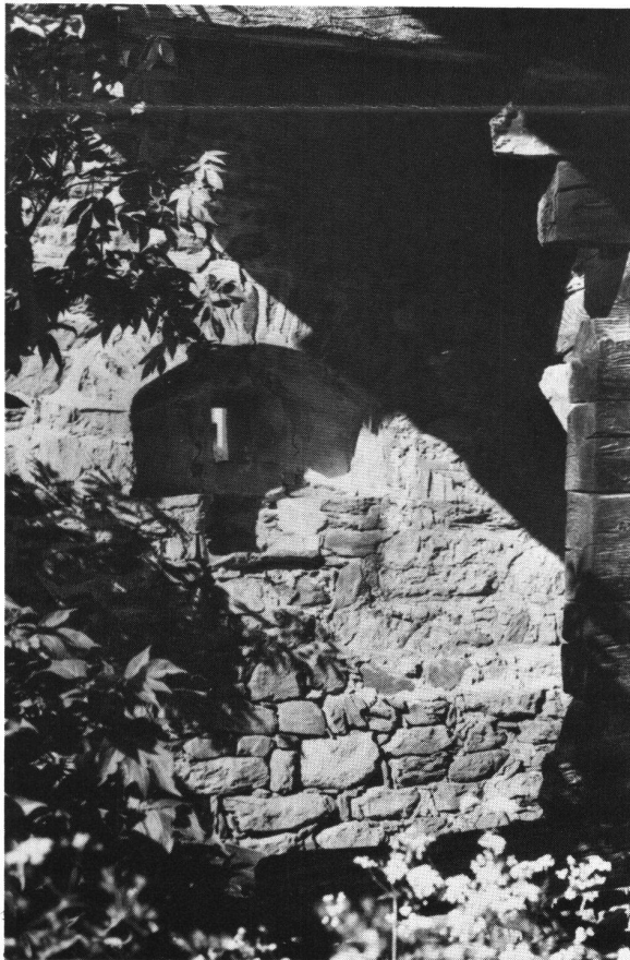
Abb. 3, Innenseite der Nordmauer des Hauses von Winkelmaten. Eine der «Schiessscharten» mündete in eine schön gemauerte Nische mit Stichbogen und Küchenausguss.

legten kleinen Hügel, der durch Überschwemmungen des Täschbaches mit Geschiebe umlagert wurde, so dass das heutige Niveau höher liegt als das ursprüngliche Umland des Mauerwerks. Es handelt sich um ein annähernd quadratisches Rechteck von ca. 9 Meter Seitenlänge. Alle vier Seiten sind erhalten, jedoch in unterschiedlicher Höhe (Bild 5). Auf der Innenseite der nördlichen Mauer wie auf der Aussenseite der im Bild sichtbaren Südmauer sind auf einheitlicher Höhe Balkenlöcher sowie eine Nische sichtbar. Die Stärke der Mauer beträgt auf allen vier Seiten ca. 90 cm. Es ist auffallend, wie der Grundriss dieses einstigen Burgturmes dem des Rotigo-Turmes von Embd gleicht. Zweifellos dürfte es sich hier um die einstige Burg der Edeln von Täsch handeln.