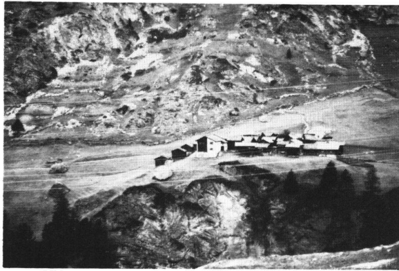
Abb. 4, Zmutt mit dem Wyss Hü; dahinter, im Bild nicht sichtbar, steht die Kapelle des Weilers.