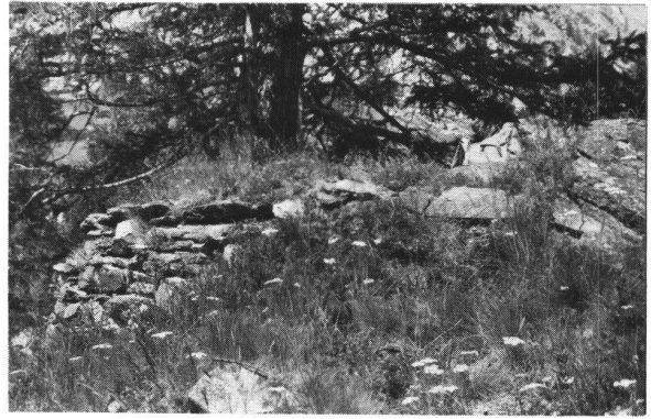
Abb. 1, Mauerrest der Burg auf Chästen ob Zermatt.

In Winkelmatten stehen einige sehr alte Blockhäuser aus dem 16. oder 17. Jahrhundert. Noch im Sommer 1977 stach einer der Altbauten besonders in die Augen. Im Sommer 1979 war er verschwunden und hatte einem Neubau Platz gemacht. Vermutlich hatte man einen Teil des Holzes für das neue Haus wiederverwendet. Die südliche Giebelseite war bis ins Detail gleich gebaut, auch hinsichtlich der Anordnung der kleinen Fenster, wie das wenige Dutzend Meter entfernte, gut unterhaltene Salzgeberhaus aus dem Jahre 1607. Dieses letztere ist jedoch ein reiner Holzbau, während das abgerissene Blockhaus als typischer Sekundärbau in die noch vorhandenen Überreste eines älteren Steinhauses hineingebaut wurde. Der Zustand von 1977 zeigte dies mit aller Deutlichkeit. Der nördliche Abschluss wurde durch eine Mauer gebildet, die ihrerseits zu zwei verschiedenen Zeiten entstanden sein musste. Bild 2 zeigt den Unterschied recht deutlich. Der grössere Teil der Rückseite dieses Hauses gehört zum primären Bestand. Rechts im Bild sind die zum Teil über einen Meter langen Binder zu erkennen. Die Mächtigkeit der Mauer betrug 75 cm. Im ersten Wohngeschoss befanden sich – über die Länge verteilt – drei schiesschartenförmige Öffnungen, die auf der Innenseite nischenförmige, mit Stichbogen versehene Ausweitungen aufwiesen. Die eine hatte zudem einen Küchenausguss (Bild 3). Auf der Oberkante des Mauerteiles wuchs Gras,